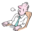
空腹感、力のめけた感じ